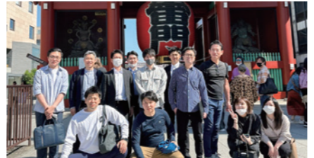
浅草寺を参拝しました

※表彰基準(仲介手数料ベース)：店舗、年間1億5000万円以上 個人、年間3600万円以上