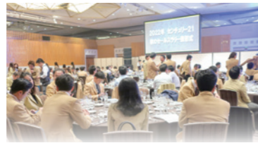
↑写真は昨年度の受賞の時のものです。