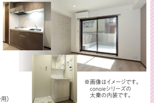
※画像はイメージです。conoieシリーズの大衆の内装です。